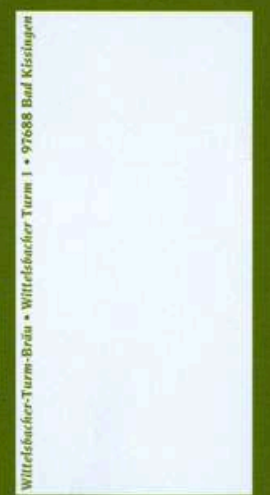
Wittelsbacher-Turm-Bräu • Wittelsbacher Turm 1 • 97688 Bad Kissingen