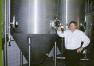
Gärkeller mit Gär- und Lager-tanks