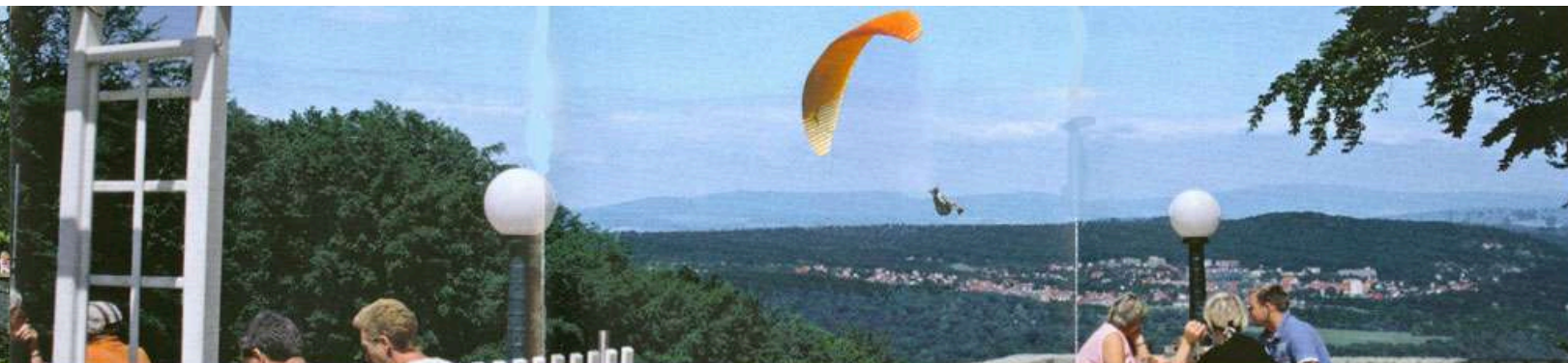
Herrlicher Blick von der grossen Terrasse auf Bad Kissingen und die bayerische Rhön