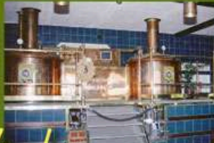
Unsere computer-gesteuerte 10 hl Sudanlage