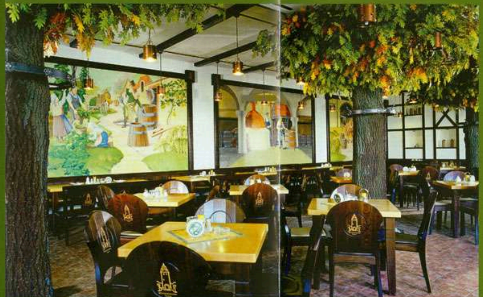
Blick in den grossen Gastraum mit Wandgemälden